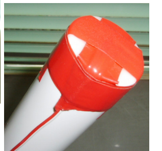
ビニールテープで脚線を保護し、着火具挿入孔を塞ぐ