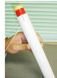
弾性波探査用カートリッジにガンサイザー薬筒のみを装填、必ず着火具側を奥にして挿入する