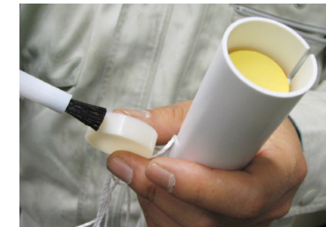
付属のキャップの側面に接着剤を塗り、キャップの底を奥にしてカートリッジにはめこみ固定する