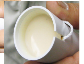
キャップを取り付けた状態