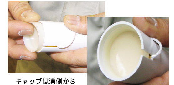
キャップは溝側から挿入すると入り易い